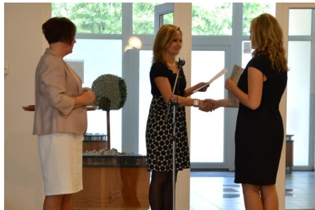
Odvzdávanie maturitných vysvedčení.