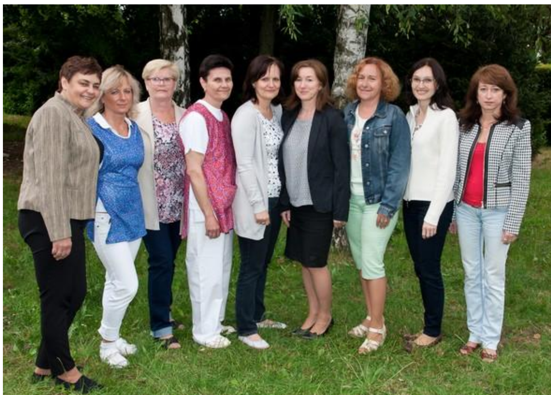
Nepedagogickí pracovníci a zamestnankyne kuchyne