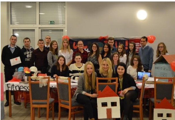
CF Build IT, s. r. o. – najlepšia CF školského veľtrhu