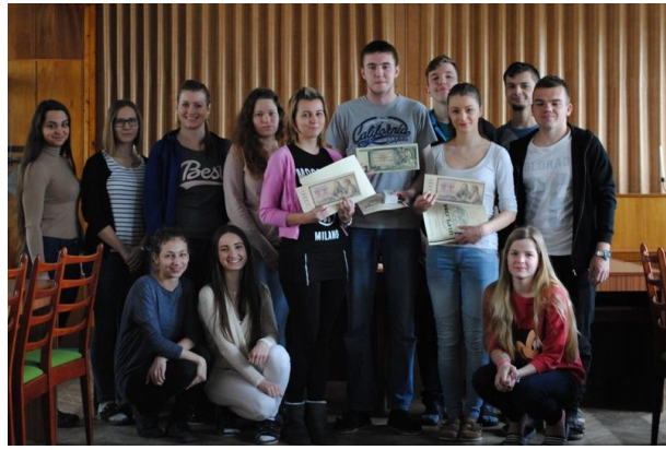
Olympiáda Mladý účtovník