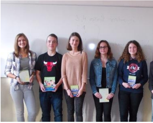
Vítazi olympiády ANJ